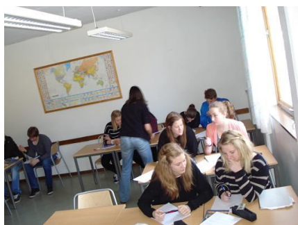
(elever på Karlberg)

Som vanligt hade eleverna vid folkhögskolan många viktiga frågor och synpunkter och diskuterade många eu-relaterade frågor aktivt och konstruktivt.