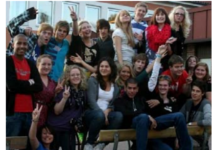
Bilden är tagen på Inspirationshelg anordnad av Sveriges Ungdomsråd där PUF deltog