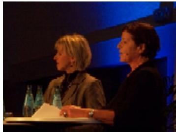
(Margot Wallström och Mechtild Rothe)

Margot Wallström, EU-kommissionär, Cecilia Malmström, EU-minister och Mechtild Rothe, Europaparlamentets vice talman invigde huset.