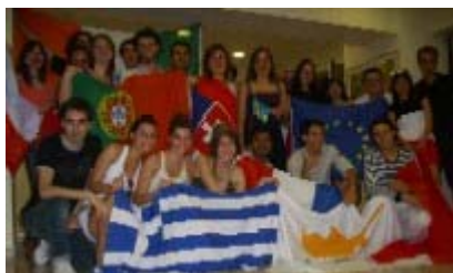
(Deltagarna på mötet i Grekland)

Temat för initiativet är "Stretch your multicultural mind, stretch your body". Det är 20 länder som deltar. Under 2 dagar i början av juni träffades ledarna för alla länder i Thessaloniki i Grekland för att prata om initiativet och målet för projektet.