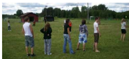
(Action på brännbollsplanen)

Den 12 juni hade Europa Direkt Åmåls Ungdomspanel sommaravslutning på Hanebols friluftsområde. På grund av yttre omständigheter så som jobb och semester var det en halverad Ungdomspanel som deltog i sommaravslutningen. Det blev en heldag som bjöd på flera olika aktiviteter; brännboll, kubb, grillade korv och namnlekar.