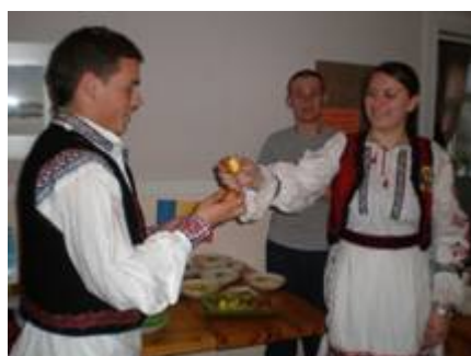
(Kulturell aften: Rumänska deltagare i traditionell folkdräkt.)

Tid fanns också för att bekanta sig med Åmål och att delta i Valborgsfirandet.