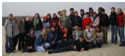
(Hela gänget samlat. Svenskar och polacker.)

Under tiden 25 april till den 1 maj 2008 åkte 15 ungdomar (15 - 19 år) på en miljökonferens till Polen. Ungdomarna tillhör Europa Direkt's ungdomspanel. Syftet med konferensen var att jämföra Sveriges och Polens åsikter och attityder om miljön, vilka problem det finns hur man "tar hand" om det i respektive land. Programmet var mycket varierande under veckan. Man besökte Gdansk, promenerade till de vandrande sanddynerna i Slovinski National Park och lärde sig lite om polsk historia och kultur. Men självklart pratade ungdomarna också om miljön. För det mesta var deltagarna delade i 5 mixade grupper. Efter vandringen till sanddynerna skulle varje grupp välja 2 bilder och säga varför de tog dem och hur det kunde se ut om 5, 10 eller 50 år.